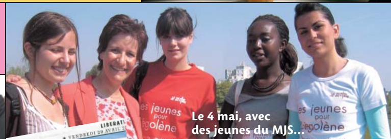
Le 4 mai, avec des jeunes du MJS...